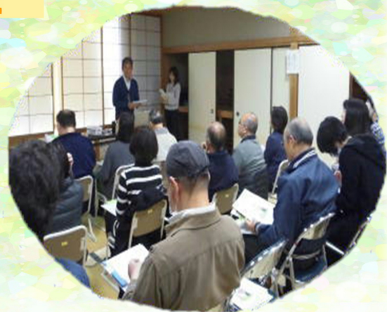
【上：子安市民センター和室にて】

どなたでも参加いただける講座ですので、未受講の方は本年度お会いできることを楽しみにしております。