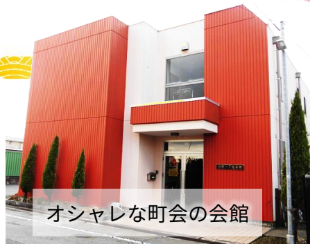
オシャレな町会の会館