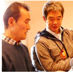
司会も協力しながら