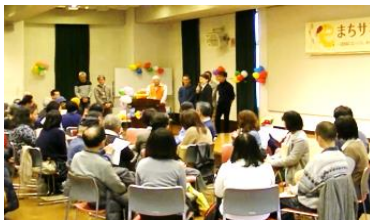
多くの市民の方が参加 幅広い世代が参集！