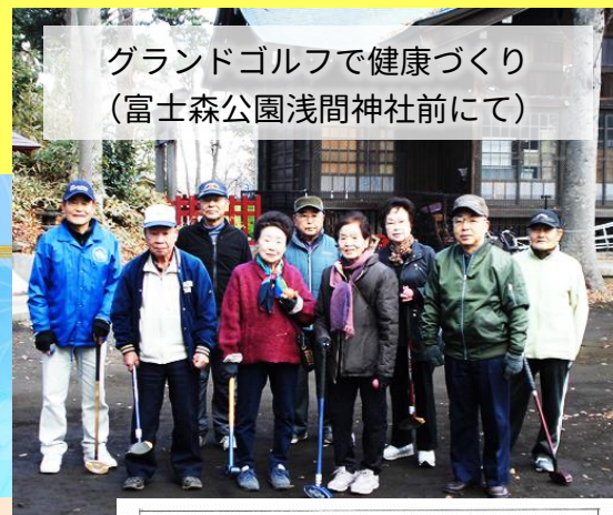
グランドゴルフで健康づくり (富士森公園浅間神社前にて)

現在、合同で、10のクラブ活動を運営しており、それぞれのグループが自主的に運営しています。グランドゴルフ、輪投げ、ペタンク、民謡(2つ)、カラオケ(目的・内容に合わせた4つの会があるそうです!)、囲碁を楽しんでおり、随時、新規会員を募集中です。